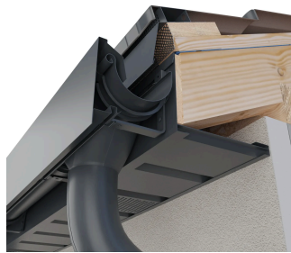
Z maskownicą czołową